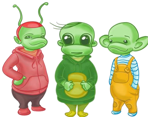
Sensibella, Titti och Höran: Funkarnas intrycksteam.

Det mesta blir enklare och funkar bättre när vi förstår varandra.